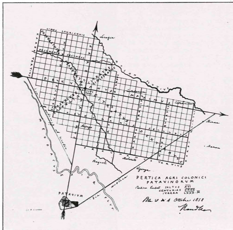
Fig. 159 - La centuriazione del territorio di Padova. Carta elaborata da P. Kandler (1858). Trieste, Biblioteca Civica.

Non bisogna dimenticare, fra l'altro, la familiarità che con quei luoghi avevano coloro che si dedicarono a queste ricerche.